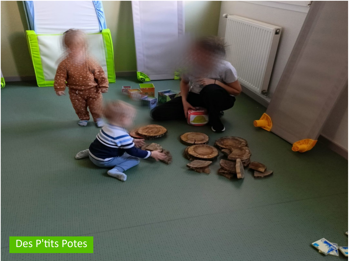
Des P'tits Potes