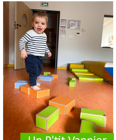
Un P'tit Vannier