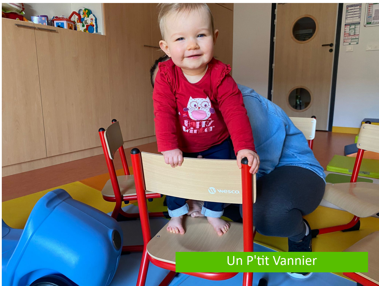
Un P'tit Vannier