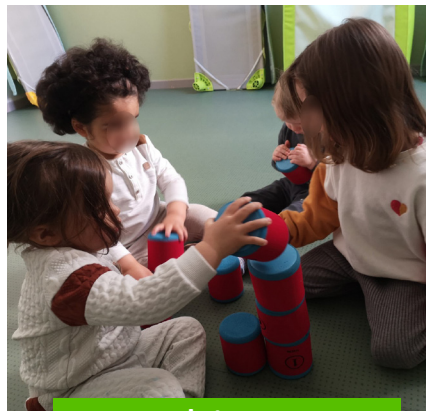
Des P'tits Potes