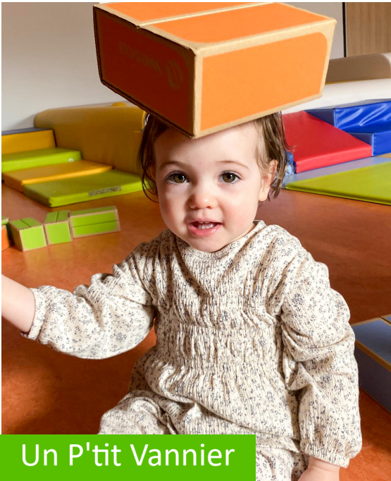
Un P'tit Vannier