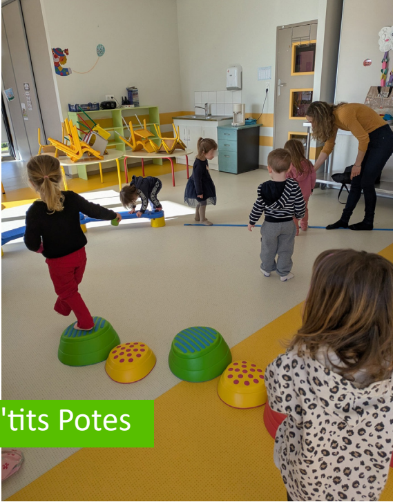
Des P'tits Potes