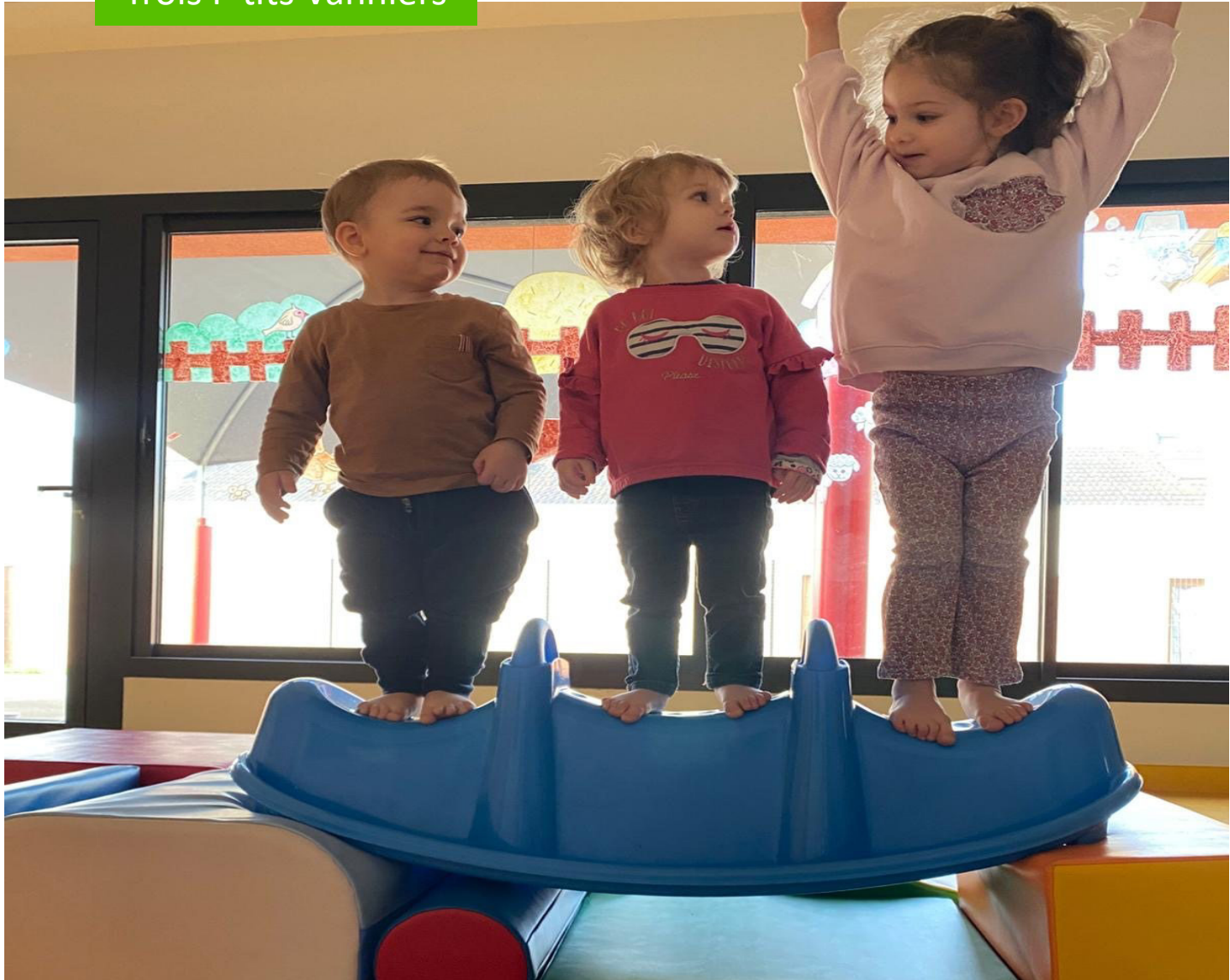
Trois P'tits Vanniers