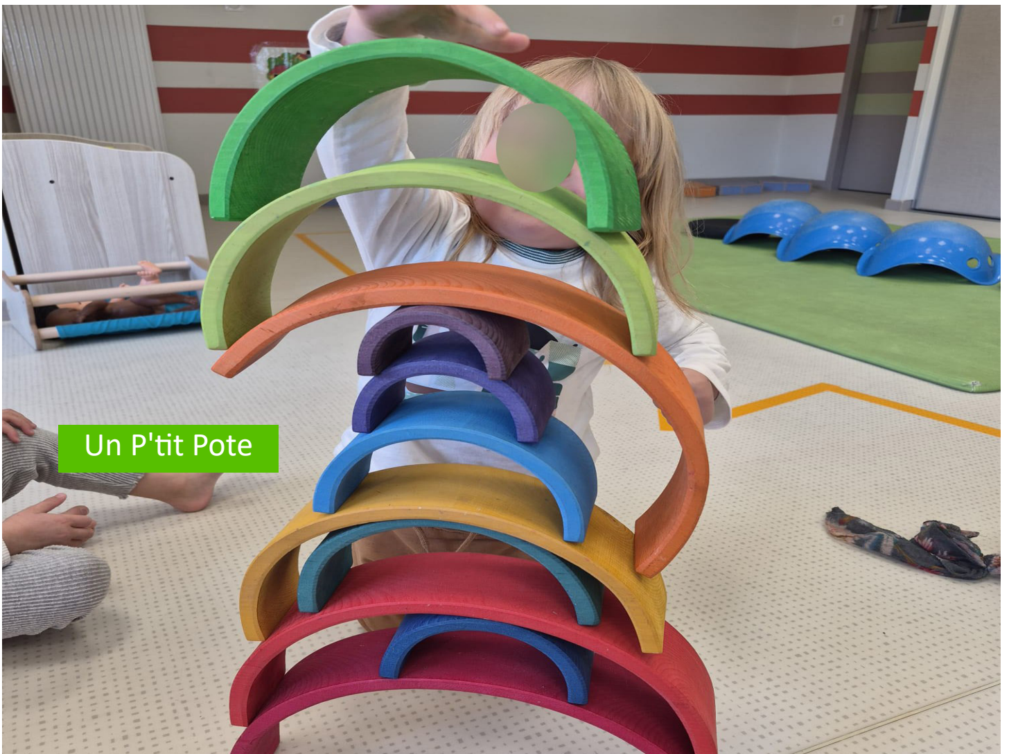
Un P'tit Pote