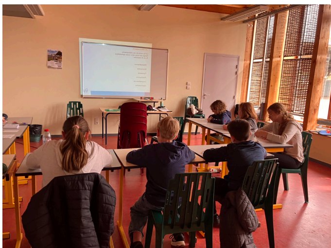
Journée de sensibilisation autour des handicaps - élèves des établissements scolaires du secteur de Fayl Billot.

L'IES dispose de 12 places pour la déficience auditive et 12 places pour les enfants porteurs de Troubles Spécifiques du Langage et des Apprentissages. Age : de 0 à 20 ans.