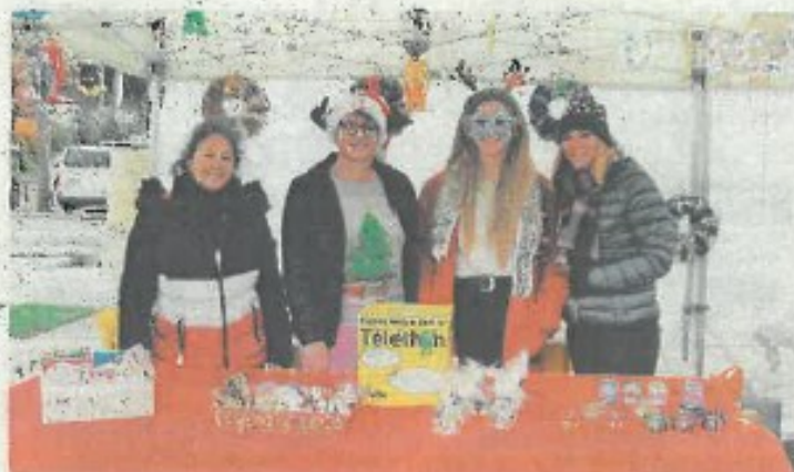
Le stand des enseignantes de l'école primaire.