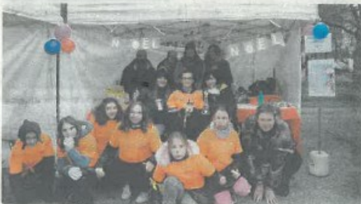
Les élèves de l'Institut médico-éducatif avaient confectionné de nombreux objets.